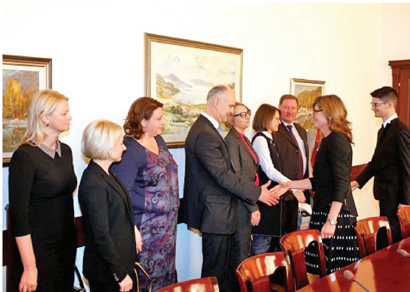
Министърът на правосъдието в оставка Екатерина Захариева прие делегацията от ЧСИ.