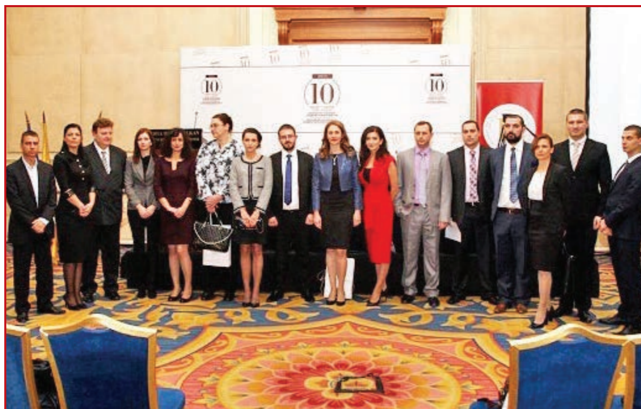
Нови ЧСИ положиха тържествена клетва на 10-тия юбилей на Камарата

Другата е, че за десет години сложихме стабилни основи и стигнахме предела на първия етап от развитието на нашата професия. В един момент бяхме на кръстопът – да бъдем успешни, добри изпълнители, да работим и да развиваме канторите си или да бъдем нещо повече от това. Да се превърнем в институция и част от механизма, чрез който държавата и законът изпълняват своя ангажимент към об-